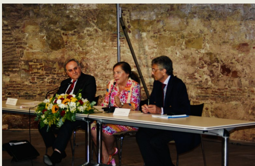
Imagen de la entrega de los Premios Pilar Moreno 2023

Se celebrará una ceremonia de entrega de premios en Lisboa, en mayo de 2024.